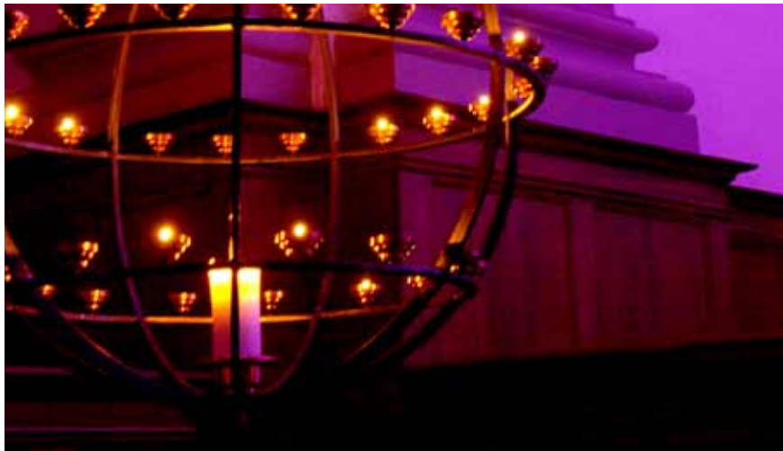
Fredag aften dæmpes belysningen og stearinlysene tændes.