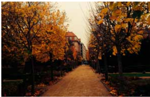
Vor Frelers Kirkegaard

”Selvom det er en kirkegård, så er der plads til liv. Her er dagligt besøg af alt lige fra dagplejemødre med barnevogne og til børnehæ-