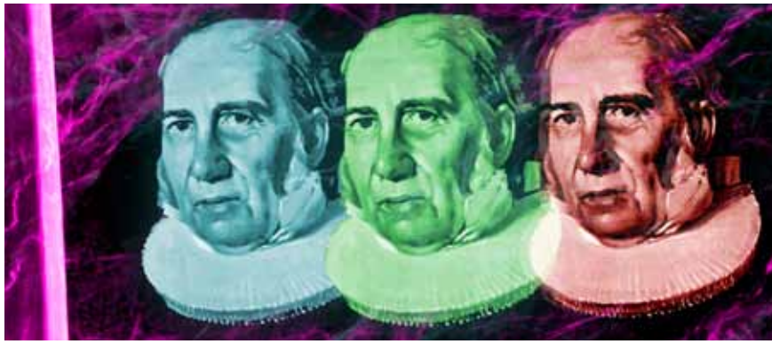
N.F.S. Grundtvig betragtes som folkehøjskolens fader.